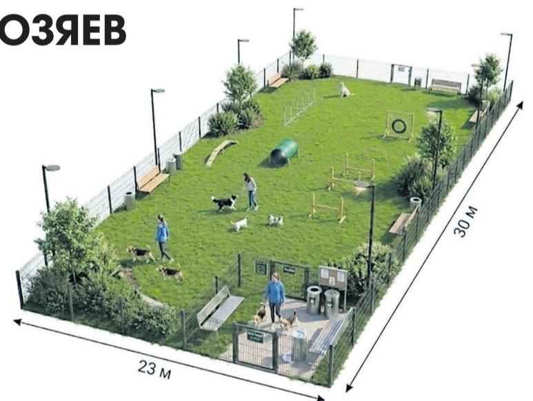
Площадка для выгула собак на территории, г. Янино-1, площадь территории – 690 кв. м

На данном этапе эскизы утверждены и направлены в сектор благоустройства, где подготовят смету по каждому из объектов и приступят к непосредственной реализации задуманного.