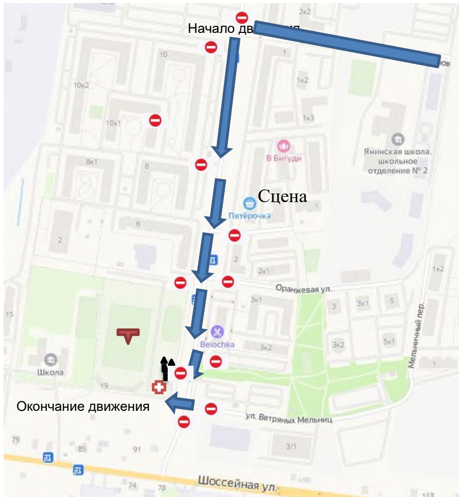
Схема движения шествия «Бессмертного полка» 09.05.2026 в гп. Янино-1

гп. Янино-1 от ул. Тюльпанов, д.1 по ул. Голландской до ул. Новая, сооружение 19 Стадион.