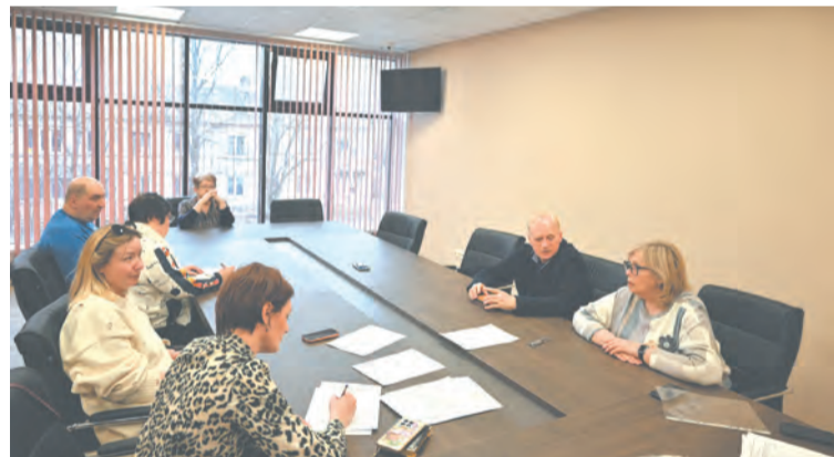
Семь жителей обратились к местным народным избранникам с вопросами и предложениями