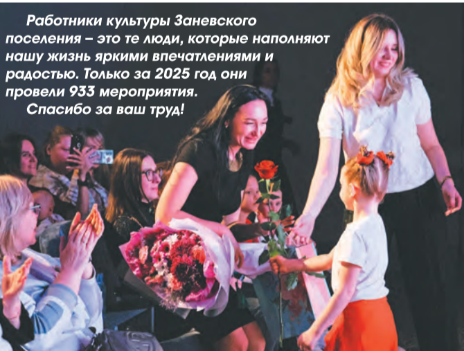
Работники культуры Заневского поселения – это те люди, которые наполняют нашу жизнь яркими впечатлениями и радостью. Только за 2025 год они провели 933 мероприятия. Спасибо за ваш труд!

относится к работе, всем помогает. Нам действительно повезло, – поделилась Виктория.