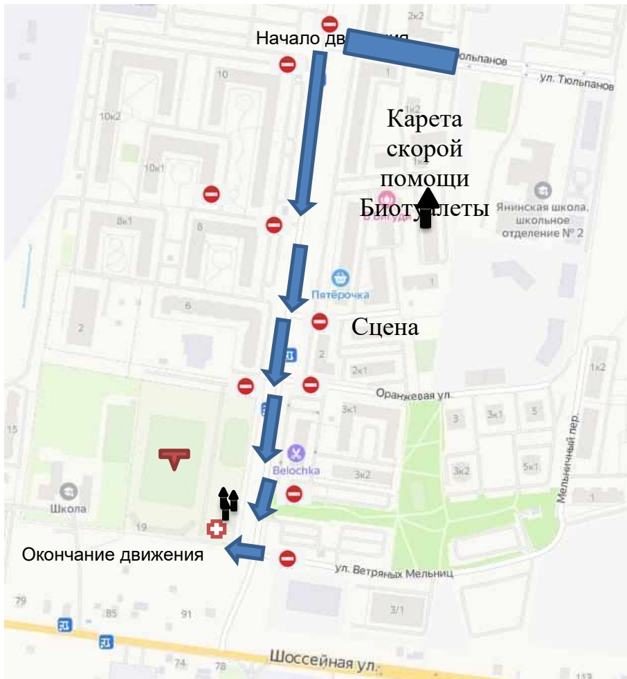
Схема движения шествия «Бессмертного полка» 09.05.2024 в гп. Янино-1

Ленинградская область, Всеволожский район, гп. Янино-1 от ул. Тюльпанов, д.1 по ул. Голландской до ул. Новая, сооружение 19 Стадион.