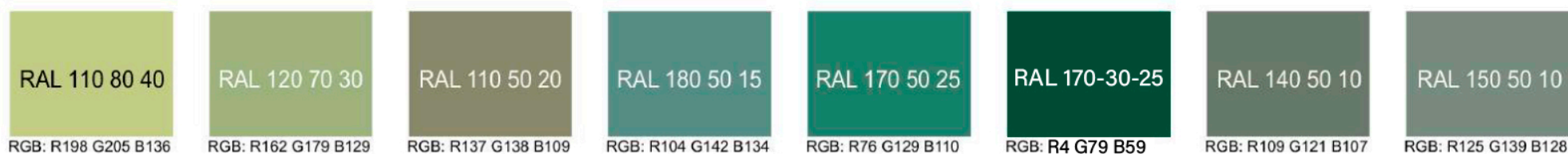
Рис. Предлагаемые колористические решения фасадов объекта, используемых отделочных материалов

Дополнительные контрастные цвета декоративных и акцентных элементов фасадных покрытий (не более 30%)