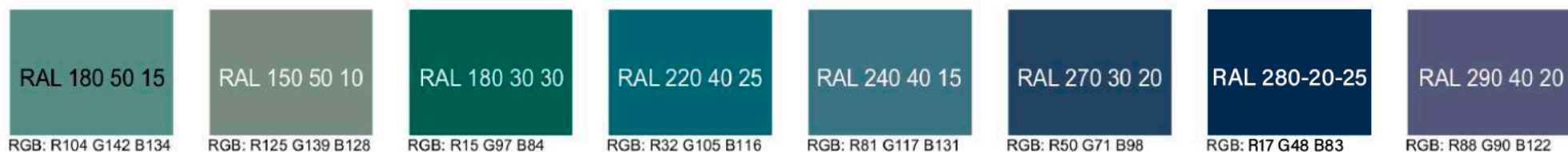
Рис. Предлагаемые колористические решения фасадов объекта, используемых отделочных материалов

Дополнительные контрастные цвета декоративных и акцентных элементов фасадных покрытий (не более 30%)