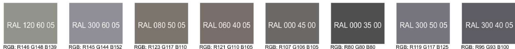
Рис. Предлагаемые колористические решения фасадов объекта, используемых отделочных материалов

Дополнительные контрастные цвета декоративных и акцентных элементов фасадных покрытий (не более 30%)