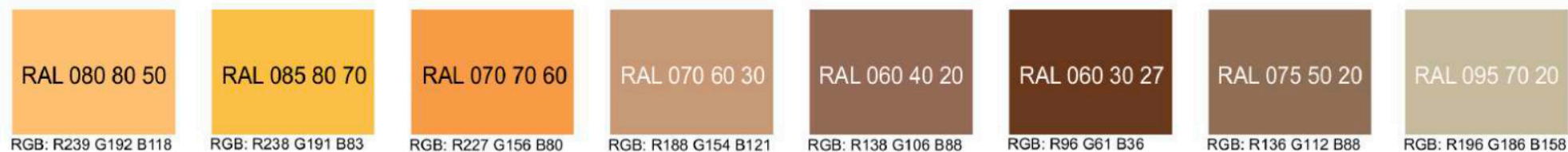
Рис. Предлагаемые колористические решения фасадов объекта, используемых отделочных материалов

Дополнительные контрастные цвета декоративных и акцентных элементов фасадных покрытий (не более 30%)