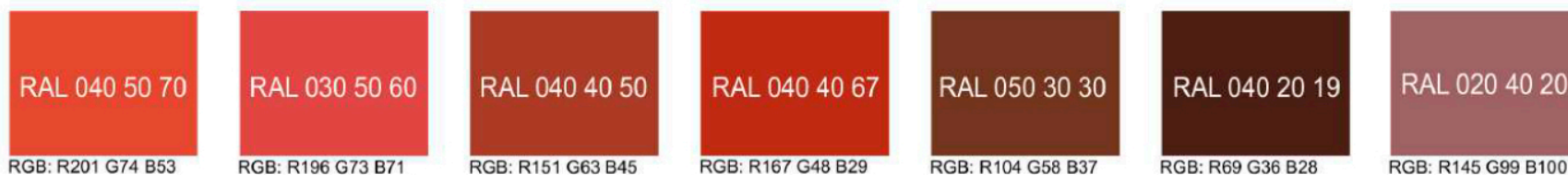
Рис. Предлагаемые колористические решения фасадов объекта, используемых отделочных материалов

Дополнительные контрастные цвета декоративных и акцентных элементов фасадных покрытий (не более 30%)