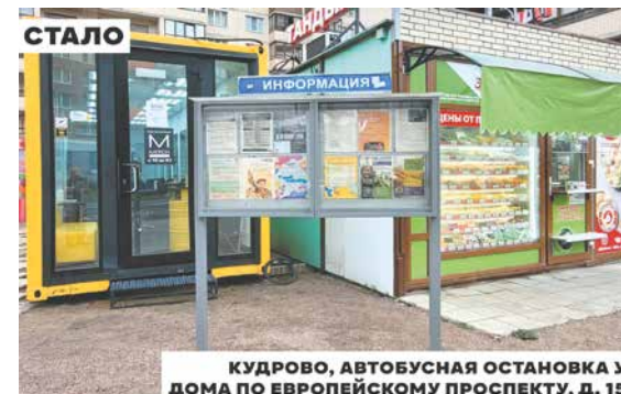
КУДРОВО, АВТОБУСНАЯ ОСТАНОВКА У ДОМА ПО ЕВРОПЕЙСКОМУ ПРОСПЕКТУ, Д. 15