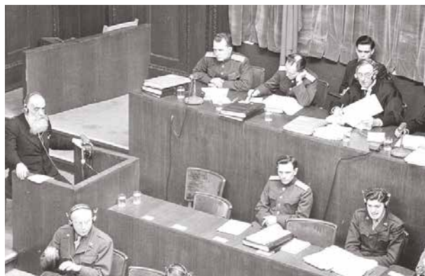
Выступление свидетеля обвинения от СССР академика И. А. Орбели об умышленном артобстреле Эрмитажа. Нюрнберг, 22 февраля 1946 года

ром, художники и реставраторы со всего Ленинграда. Они шли по зову сердца. Слишком многое было на кону. Благодаря заблаговременной подготовке и круглосуточной работе первый эшелон, в состав которого вошли полмиллиона экспонатов, собрали с 23 по 30 июня. Второй эвакуировали 20 июля. А третий вывезти не успели: сомкнулось кольцо блокады.