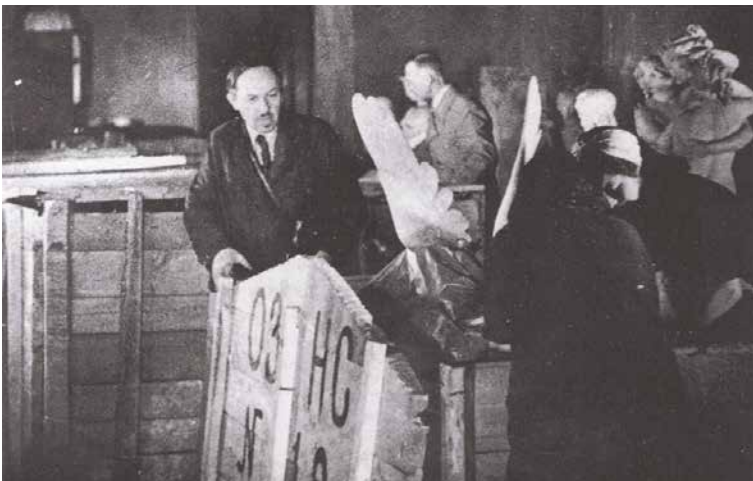
Упаковка коллекции Эрмитажа перед эвакуацией

Хитроумный план был раскрыт быстро. Тогда изыятия стали происходить либо по предварительному заказу из-за границы, произ-