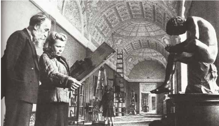
Профессора Орбели волновала судьба каждого экспоната

В кругах историков и искусствоведов имя Иосифа Орбели известно далеко за пределами нашей страны. Его знают как выдающегося востоковеда, директора Эрмитажа, дважды спасшего величайшую сокровищницу мира, создателя и первого президента Армянской академии наук, мастера своего дела, посвятившего всю жизнь поиску, изучению и сохранению культурного наследия.