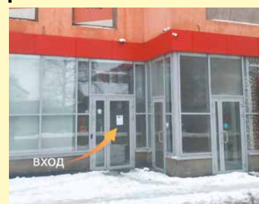
График работы МФЦ «Мои документы» в Кудрово

с понедельника по пятницу – с 9:00 до 20:00, в выходные – с 9:00 до 18:00.