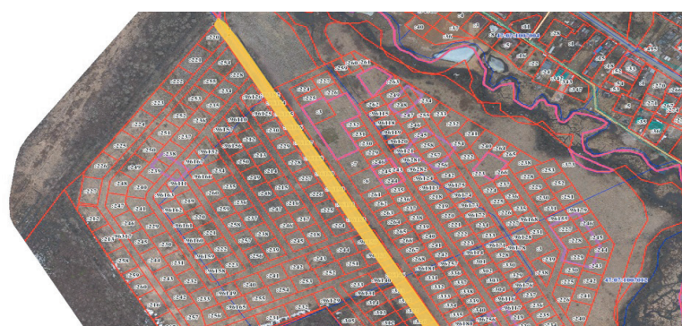
Желтой полосой на схеме отмечена территория, по которой, согласно генплану, пройдет дорога районного значения

Более того, фирма оборудовала мост и подъезд к площадке, проигнорировав генплан. В будущем такое пренебрежение может привести к признанию этих объектов самостроями и, соответственно, сносу. Пока находящиеся в неведении люди приобретают участки и начинают вить свое гнездышко, администрация выполняет свою работу: формирует наделы, через которые проляжет проезжая часть. На понимание со стороны «Северной долины» надеяться не приходится, предприниматели попросту не идут на контакт, поэтому все, что остается муниципалам – следовать букве закона.