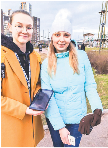
Новый парк в Кудрово появится на участке между улицами Новая,

Волонтерский штаб Заневского поселения присоединился к голосованию по отбору объектов благоустройства в рамках федерального проекта «Формирование комфортной городской среды». Опрос стартовал 26 апреля на сайте: 47.gorodsreda.ru