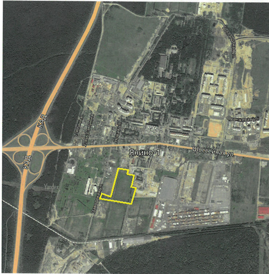
Рис.1 Ситуационный план

Территория земельного участка с кадастровым номером 47:07:1039001:12599 расположена южнее Шоссейной улицы, с выходом по западной границе на Заводскую улицу.