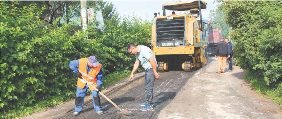
Наказ выполнен: долгожданный ремонт улицы Центральная в Хирвосты

Еще одно решение было принято о переводе собственности поселения в район. Всего на балансе муниципалитета находится 373 объекта недвижимого имущества и 383 – движимого. Размер муниципальной казны вырос относительно 2019 года на 19 % и составил 3 765 005 589,71 рублей. Это огромная сумма, но в бюджете достаточно средств на обслуживание имущества, что свидетельствует о стабильности развития поселения.