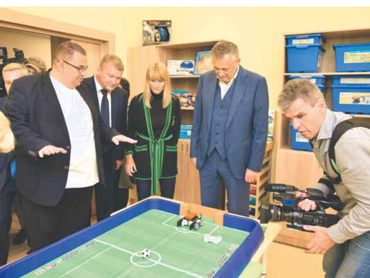
За последний год в поселении открылись три детских сада

В текущем году должна быть продолжена работа по совершенствованию нормативной базы, ее актуализации в соответствии с последними изменениями законодательства. Следует активно развивать сотрудничество с районными, региональными и федеральными органами власти.