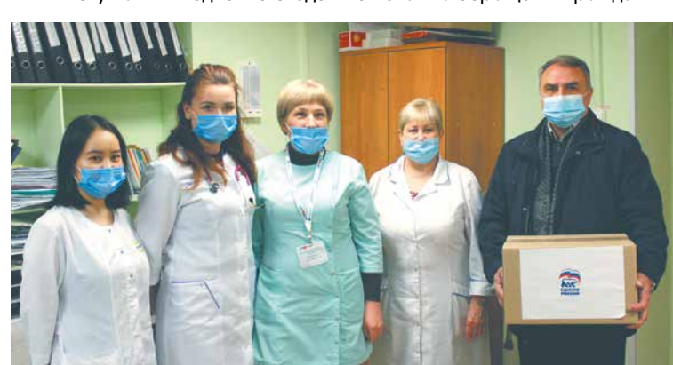
Медикам в сложный период – СИЗ и сладкие сувениры для детей