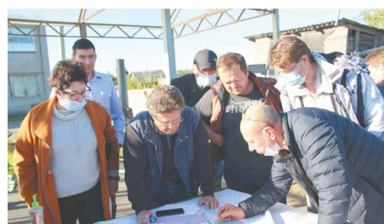
Встречи с жителями необходимы для эффективной работы органов власти