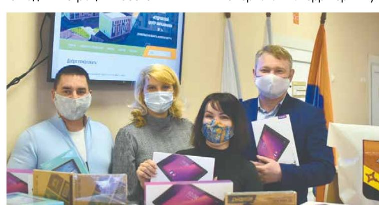
Депутаты Заневского поселения передали школьникам 34 планшета