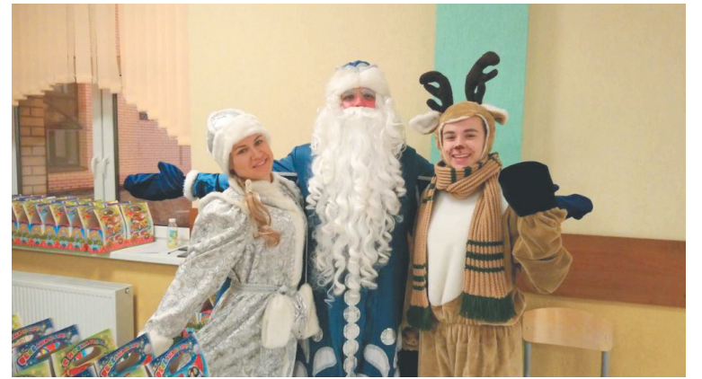
Фото из архива 2019 года: раздача подарков в ЦО «Кудрово»

Презенты получают дети от трех до 10 лет включительно. Наборы