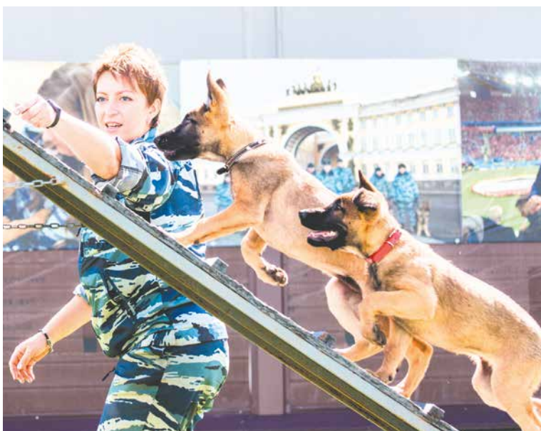
«Курсанты» постигают азы с энтузиазмом

Тем не менее кинологической службе часто приходится отдавать в добрые руки питомцев, не сумевших пройти все необходимые тесты. В основном это совсем еще щенки, которым предстоит еще многому научиться. Но самое важное, что они уже приобрели от природы и закрепили в процессе дрессировки – способность стать человеку не только надежной защитой, но и лучшим другом.