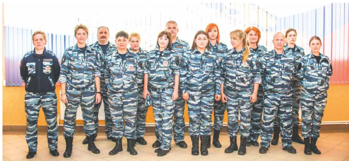
Сплоченная команда профессионалов готовит четырехлапых полицейских к безупречной службе

На территории ЦКС есть ветеринарная служба, сектор разведения и выращивания щенков, отделение для обучения специалистов-кинологов, футбольное поле, спортивный зал и специально обустроенная площадка для тренировки собак. В учреждении работают около 30 человек и 10 внештатных сотрудников. Они готовят лабрадоров, бельгийских и немецких овчарок и ризеншнауцеров. Каж-