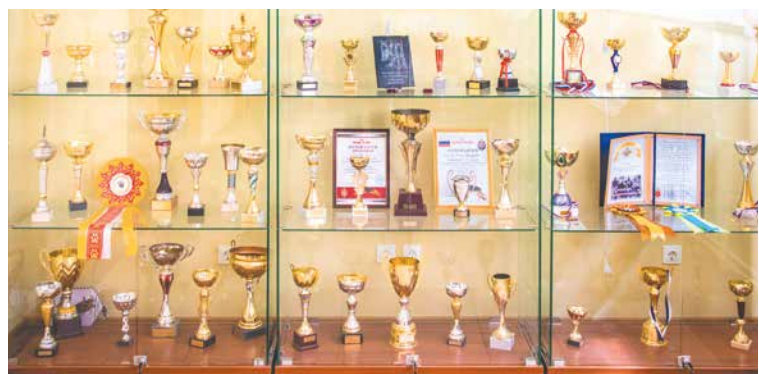
Витрина славы кинологического центра

Кличка каждого щенка из помета начинается с одной и той же буквы алфавита. Многие кинологи стараются назвать своих подопечных как-нибудь по-особенному, звучно,