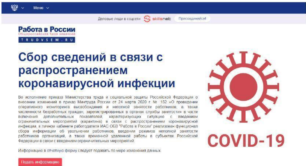
Рис. 2. Информационная страница