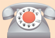
ГРАФИК ПРИЕМА В ЯНИНО-1 (Кольцевая, 8, корпус 1)