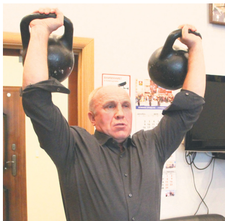
Физкульт-пятиминутка во время рабочего дня позволяет сохранять здоровье

– Все дело во мнении, которое сложилось о нашем муниципалитете: мы, мол, самодостаточны. Зачем помогать, если со всем справляемся сами. Раньше так и было, но с каждым годом нагрузка на бюджет растет. Софинансирование из других источников – это хорошее подспорье для дальнейшего развития поселения.