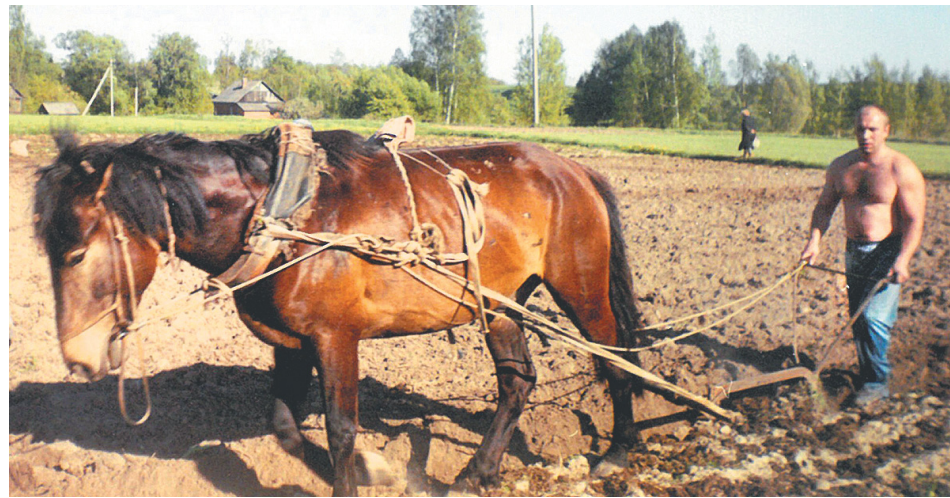
Работа на земле дисциплинирует

По поводу расположения медучреждения. Еще раз подчеркну, что комплекс возводится именно там, где должен. Этот участок