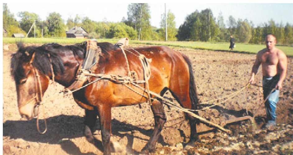
Работа на земле дисциплинирует

По поводу расположения медучреждения. Еще раз подчеркну, что комплекс возводится именно там, где должен. Этот участок