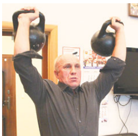
Физкульт-пятиминутка во время рабочего дня позволяет сохранять здоровье

– Все дело во мнении, которое сложилось о нашем муниципалитете: мы, мол, самодостаточны. Зачем помогать, если со всем справляемся сами. Раньше так и было, но с каждым годом нагрузка на бюджет растет. Софинансирование из других источников – это хорошее подспорье для дальнейшего развития поселения.