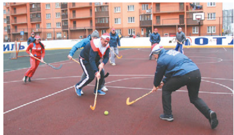
Команда звезд одержала победу со счетом 5:1