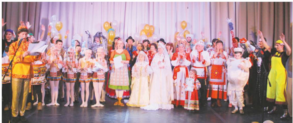
Всем участникам вручили благодарственные письма от районной администрации

Извечная борьба между добром и злом выразилась в настойчивом стремлении Кощея Бессмертного и его приспешников – бабок-ёжек и кота Баюна – усыпить Деда Мороза и Снегурочку, украсть чудо-посох и тем самым сорвать Новый год. На защиту дорогого всем праздника бросились три поросенка, Емеля и даже говорящая Щука. Положительные герои не только спасали тор-