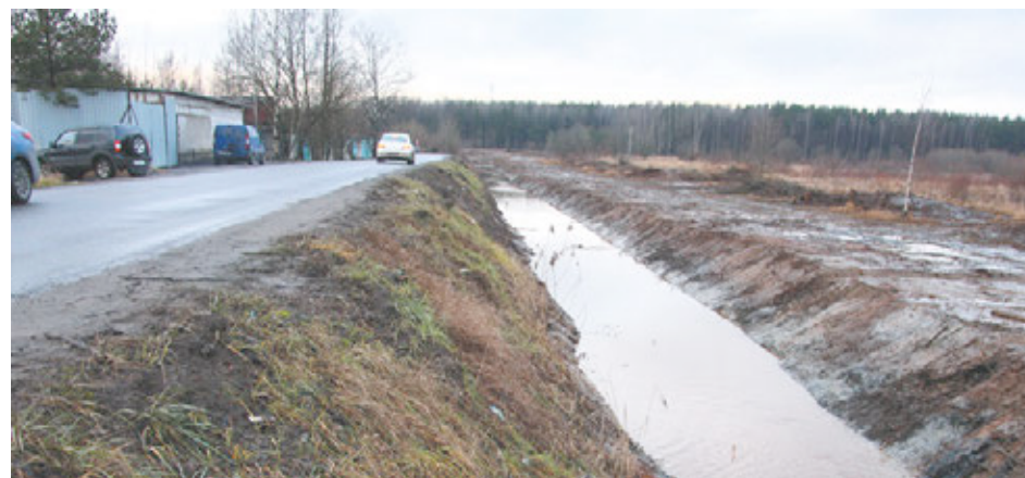
Отсутствие ограждения создает опасную аварийную ситуацию на неосвещенном повороте