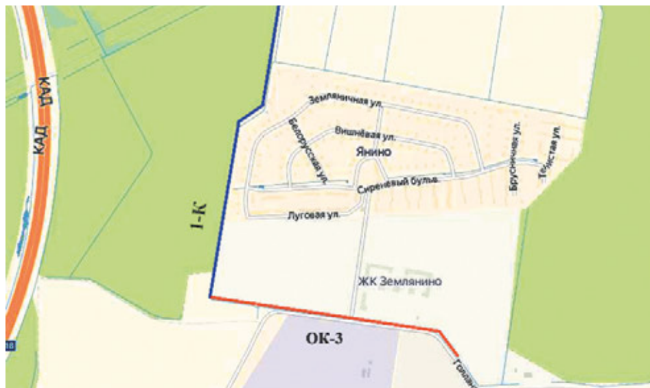
Схематичное изображение ливневых каналов. Красным цветом выделен ОК-3, синим – 1-К

По итогам совещания, состоявшегося в Заневке, собственникам коттеджного поселка, представителю лесничества и собственнику межхозяйственного канала предложено выполнить работы по установлению границ земельных участков на местности. Кроме того, специалисты администрации направят письмо в Управление мелиорации земель и сельскохозяйственного водоснабжения по Санкт-Петербургу и ЛО с целью уточнить план развития существующей системы мелиорации в связи с интенсивной застройкой и увеличением объема сточных вод и изменения назначения ливневого канала. До выяснения ситуации проведение работ на протяжении 300 метров вдоль западной части коттеджного поселка приостановлено. Повторное совещание состоится не позднее 28 декабря