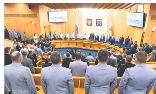
Лучших дружинников чествовали в рамках Дня сотрудника органов внутренних дел РФ

основном дружинники сталкиваются и борются с разведением огня в парке «Оккервиль», курением, распитием спиртного, выгулом собак и парковкой автомобилей в неподобающих местах. Нарушения ПДД фиксируются на камеру, а фото отправляются в отдел ГИБДД Всеволожского района. Кроме того, приходится иметь дело и с любителями громкой музыки в вечернее время, и с пьяными дебоширами. Представители ДНД постоянно взаимодействуют с дежурно-диспетчерской службой местной администрации и