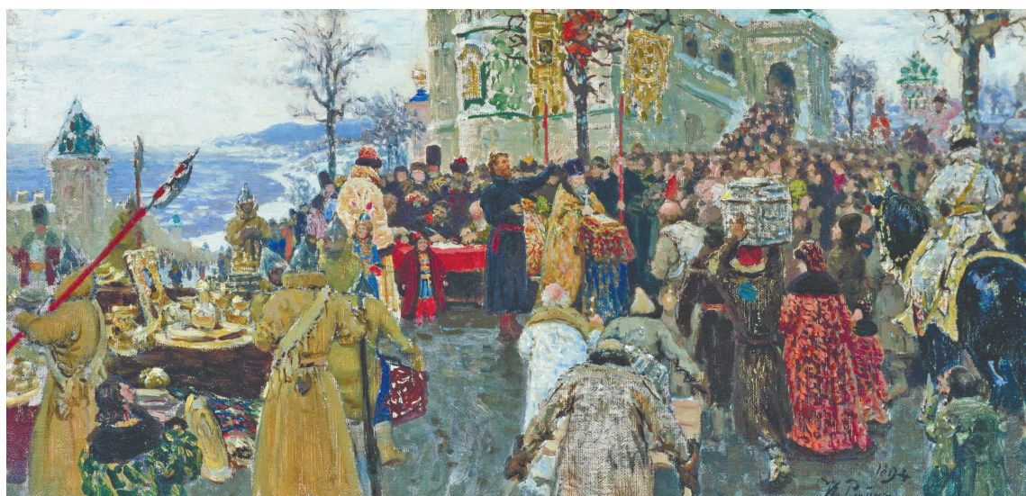
Илья Репин. «Кузьма Минин». 1894 год