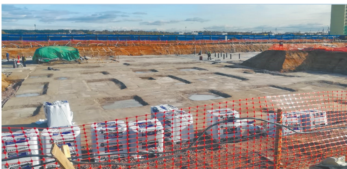
Фундамент школы в Яино-1

В рамках данной программы уже начато возведение детского сада на 295 малышей в Кудрово