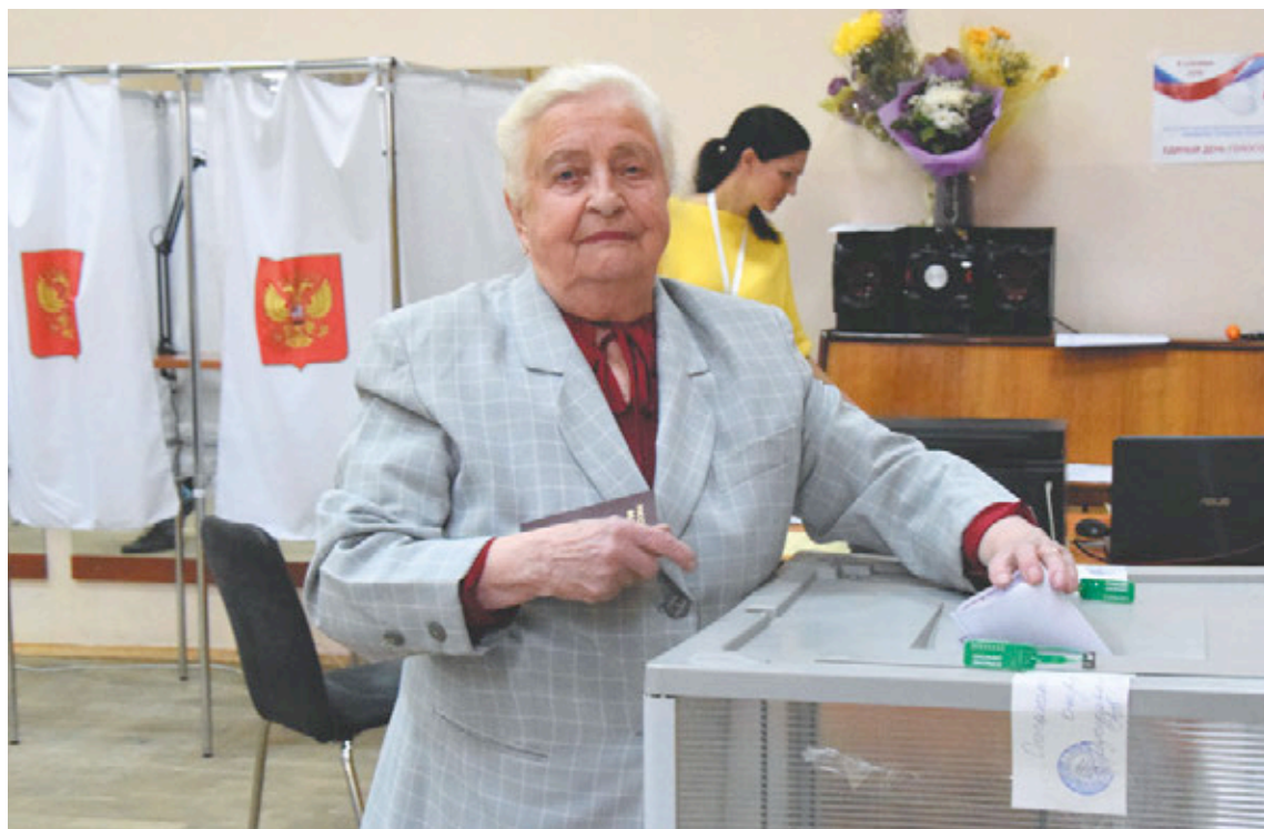
Судьба поселения – ответственность каждого

Стоит отметить, что из 20 избранных депутатов 17 состоят в