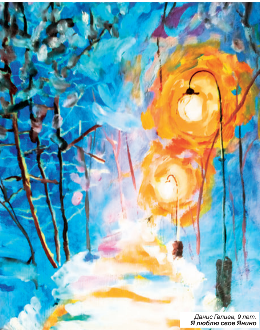
Данис Галиев, 9 лет. Я люблю свое Яино