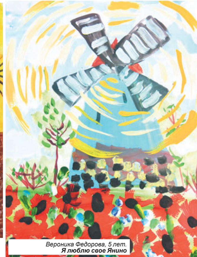
Вероника Федорова, 5 лет. Я люблю свое Яино