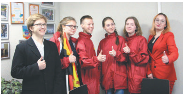
В мае 2019-го молодежному совету выделили собственное помещение. Об этом – в выпуске газеты «Заневский вестник» № 25 (412) от 17 мая

Администрация Заневского городского поселения разработала программу по развитию молодежной политики на 2020–2022 годы. Для ее реализации из местного бюджета выделят около 12 миллионов рублей.