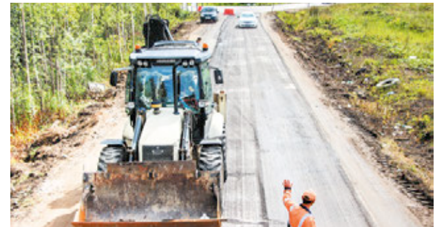
Движение по Голландской затруднено до 20 августа: идет ремонт картами

В прошлом году местная администрация произвела ямочный ремонт площадью 3240 квадратных метров в Суоранде, Янино-1 и Заневке, заасфальтировала 5300 квадратных метров улицы Питерская в Заневке и выложила тротуар от автобусной остановки на Шоссейной улице к школе в административном центре. Кроме того, возле образовательного учреждения появилась автостоянка площадью 1200 квадратных метров. А в Кудрово заасфальтировали пешеходную дорожку от Центральной до Ленинградской улицы. Помимо этого, во всех населенных пунктах поселения был произведен ремонт дорог с грунтовым покрытием.