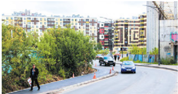
Кудровский проезд расширили до нормативных 3,75 метров и добавили тротуар

Долгожданное расширение Кудровского проезда до 3,75 метров завершено. В будущем это позволит запустить движение общественного транспорта в обе стороны. Ранее состояние объекта не соответствовало региональным нормативам градостроительного проектирования Санкт-Петербурга и Ленинградской области. Зато теперь у новой дороги появился тротуар. Его построили на участке от Центральной улицы до железнодорожного переезда.