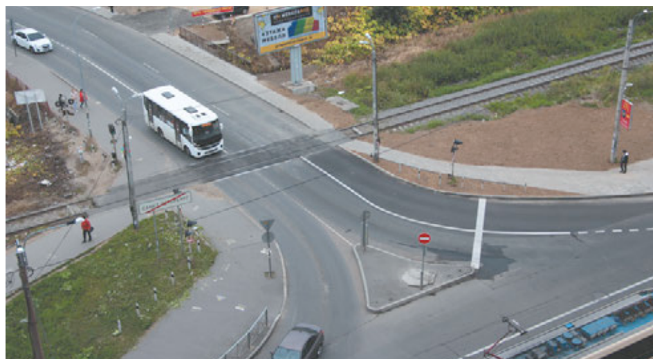
Работы проведены за рекордно короткий срок – 2 суток

– Да. Но зато ради полноценного результата и в интересах тысяч жителей Кудрово!