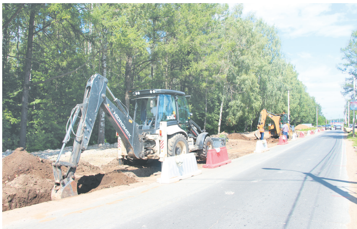
Ведется расширение 1-й линии в Янино-1