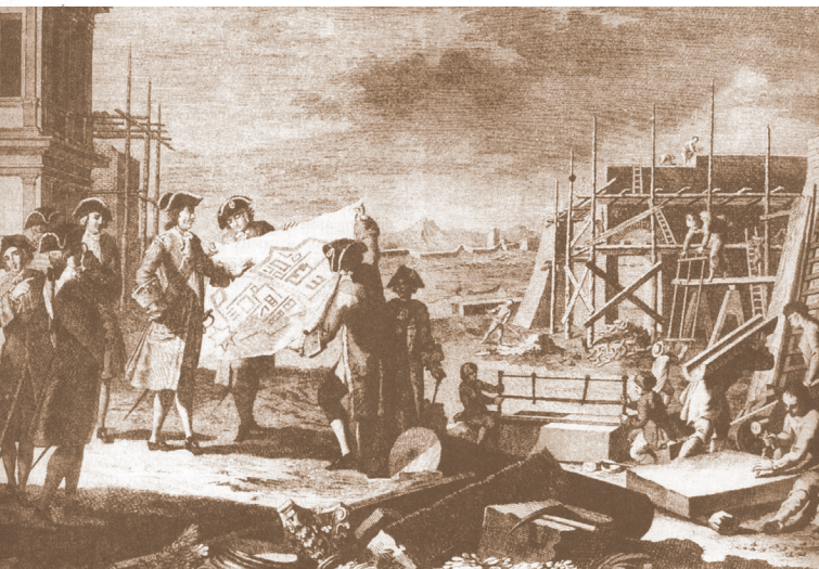
Возведение Петропавловской крепости. Санкт-Петербург, 1703