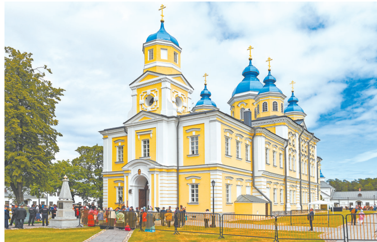
Собор Рождества Богородицы вновь принимает паломников