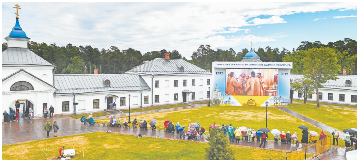
Наблюдать за церемонией освящения можно было с экрана, установленного во дворе

После литургии для гостей провели экскурсию. В ходе неформального общения кудровские паломники рассказали патриарху Кириллу о строящемся храме Апостола Иоанна и пригласили на открытие. Его Святейшество выразил одобрение, порадовался за приход и благословил всех присутствующих.