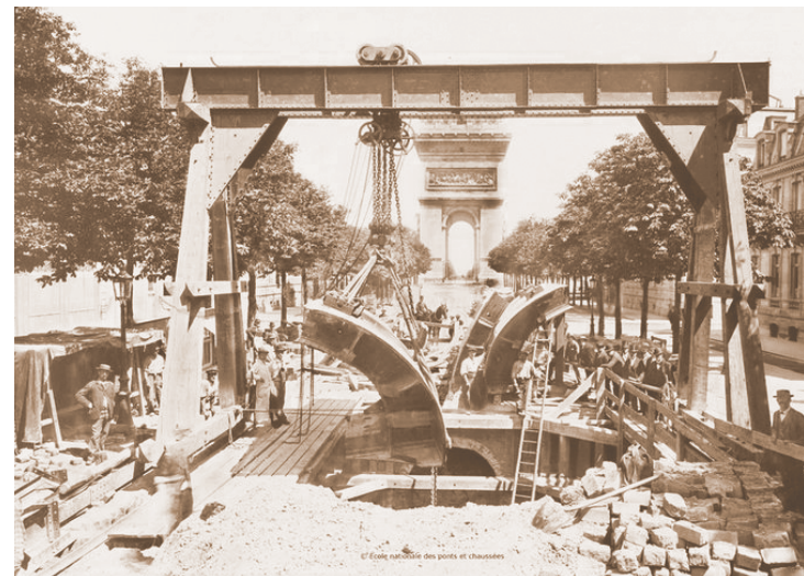
Будущий метрополитен. Париж, 1898