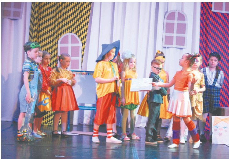
Юные кудровчане впервые выступают на профессиональной сцене

В постановке участвовали 14 ребят из 1–3 классов. Несмотря на то, что занимаются они уже год, это был их первый выход на настоящую сцену. В Кудровском центре образования студия под руководством Наталии