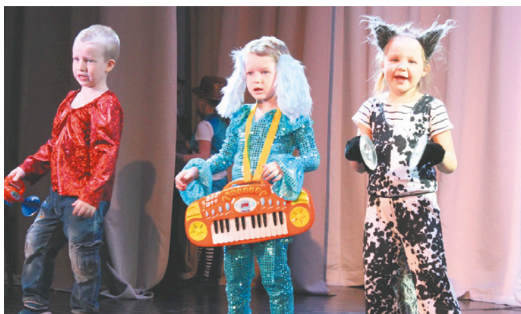
Еще без грима, но уже в костюмах: репетиция спектакля «Бременские музыканты»

Днем ранее отчетный спектакль «Бременские музыканты» представили ребята из янинской студии. В песне участвовали около 30 человек из младшей группы «Карандаши» и средней «Бублики».