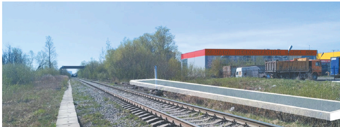
Эскиз-привязка платформы к местности

Будет организовано челночное движение. Поэтому возведут только одну платформу на бетонных блоках. Ее длина – 60 метров, ширина – 3 метра и высота – 1 метр. Также будут предусмотрены дорожки для подхода к месту посадки и высадки пассажиров.