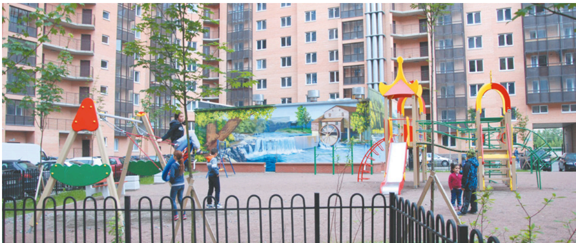
Когда «Наш дом» – наш не просто на словах. На фото: двор на улице Областной, 1

Да, такие бывают. Вот такая сегодняшняя наша «Человеческая составляющая».