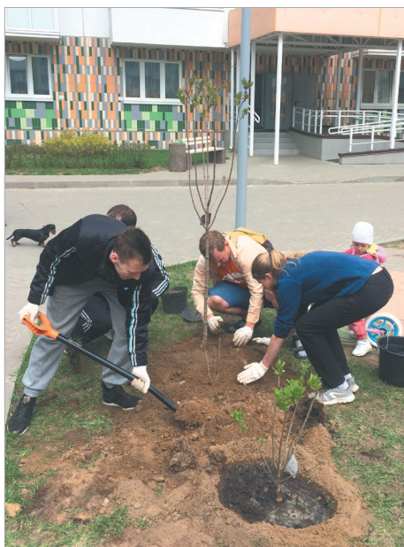
Активное участие в благоустройстве квартала «Янила Кантри» приняли порядка 100 местных жителей и организаторов

30 апреля сотрудники администрации и депутаты Заневского городского поселения организовали традиционный субботник, посвященный подготовке ко Дню Победы. Привели в порядок памятные места. Очистили от мусора и сухой травы