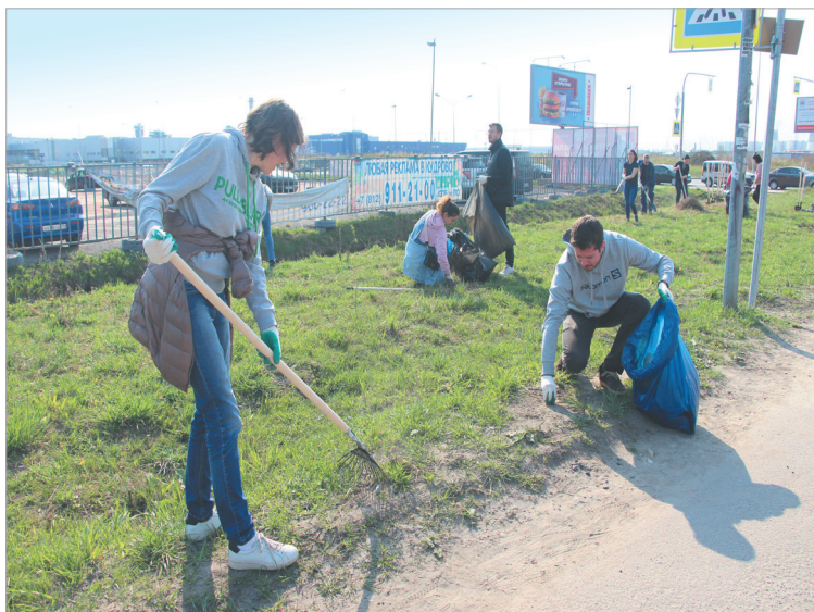
Поддержать месячник благоустройства вышли сотрудники ТЦ «МЕГА Дыбенко» и магазина IKEA

мусор. После долгих уговоров посетители парка все-таки освободили территорию и позволили госслужащим продолжить работу. Однако сохранить чистоту не удалось: за выходные люди оставили