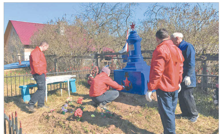
Обновили краску на стеле захоронения балтийцев, погибших в Великой отечественной войне

в порядок памятные места. Очистили от мусора и сухой травы