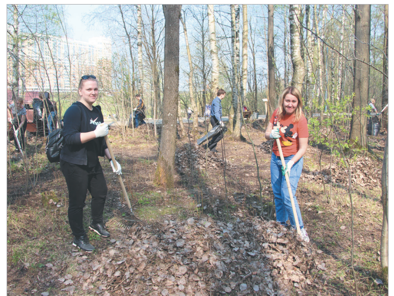
Березовую рощу в Кудрово и территорию парка убрали 140 сотрудников муниципального образования и правительства Ленобласти

Еще одна группа специалистов прибиралась на Рабочей улице в Суоранде. Именно на ней будет