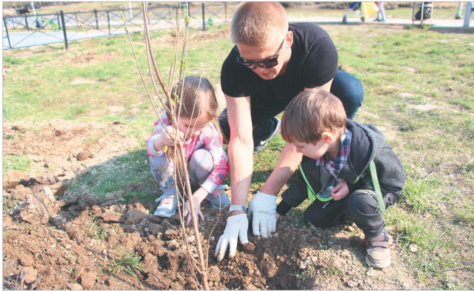
Субботник в «Оккервиле» вызвал интерес и у маленьких граждан, гуляющих на детских площадках

В Заневском городском поселении прошли массовые субботники. К ним присоединились жители, представители бизнеса, строительных компаний, а также региональные и муниципальные власти.