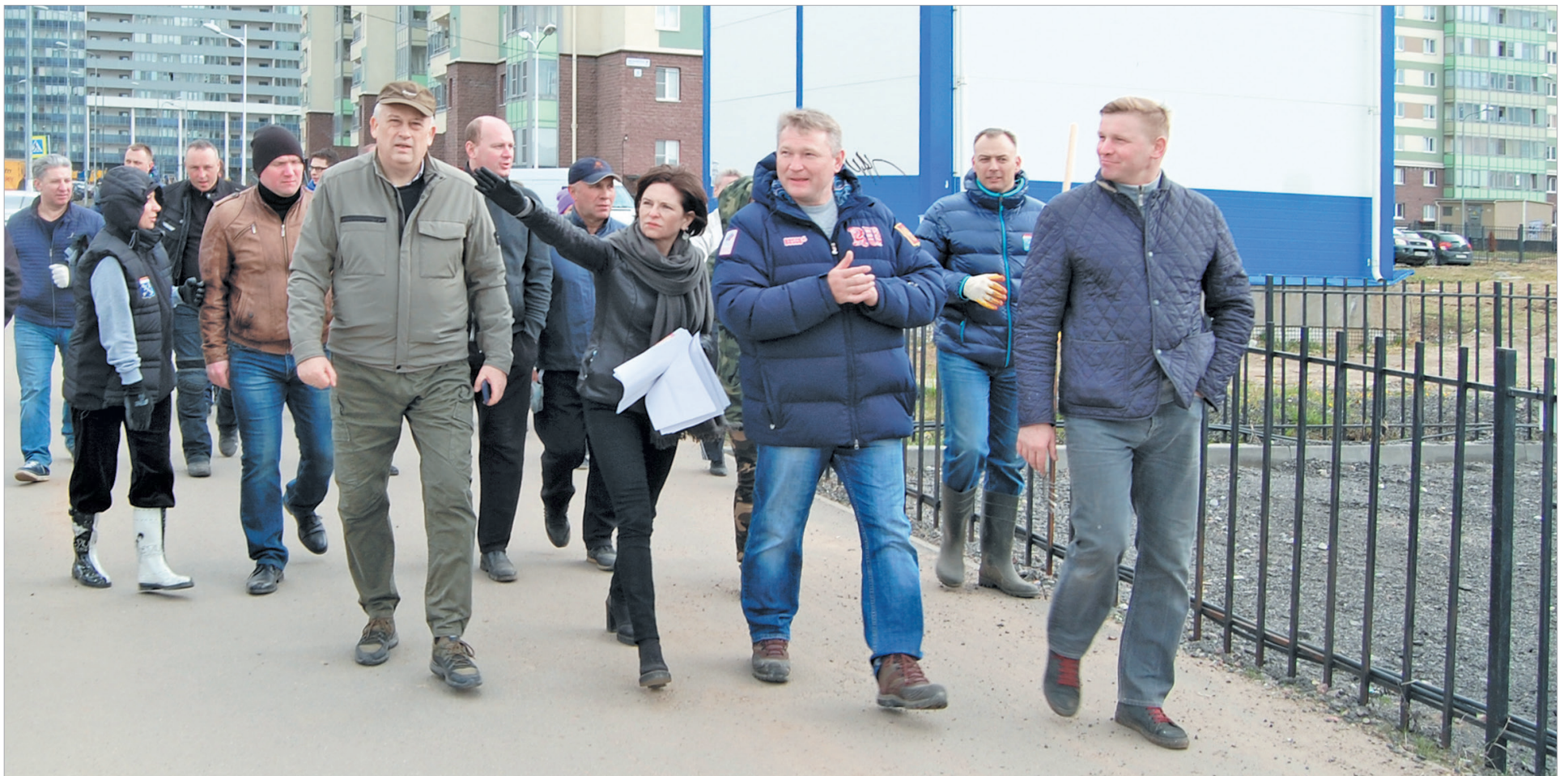
Губернатор Ленобласти, руководители Заневского поселения и глава Всеволожского района осмотрели потенциальные места под размещение полиции в Кудрово

В середине апреля в 47-м регионе стартовал месячник по благоустройству, в рамках которого местные власти и неравнодушные жители занимаются уборкой и озеленением населенных пунктов. В минувшую субботу поддержать инициативы сразу трех поселений Всеволожского района приехал губернатор Александр Дрозденко.