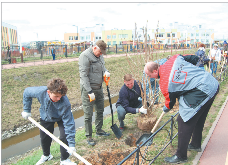
Вдоль Безымянного ручья высадили 40 кустов сирени и 10 каштанов