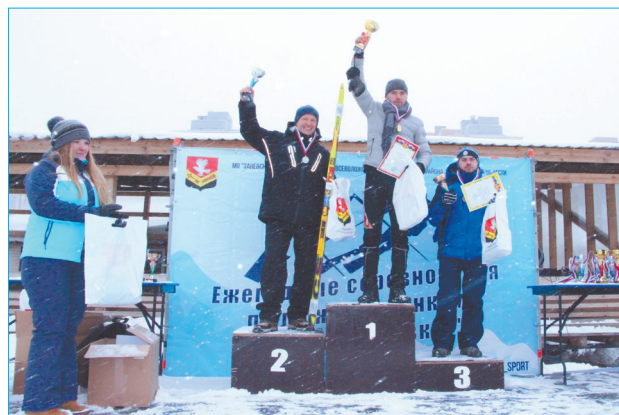
Даже метель не испортила настроение победителям