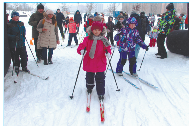
Старт на дистанции в 900 метров