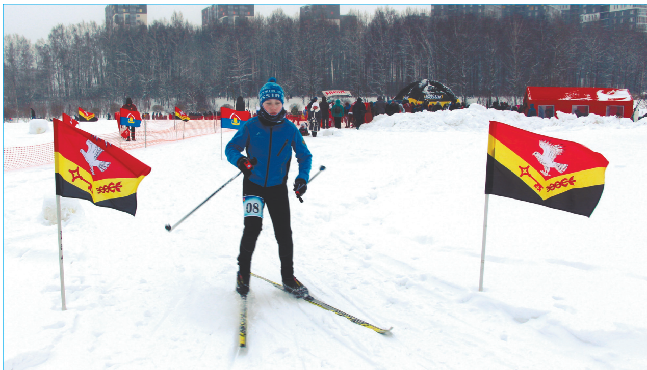
В «Лыжне Заневки – 2019» приняли участие 70 детей

В Кудрово в очередной раз прошли уже полюбившиеся многим жителям и гостям поселения массовые соревнования по лыжным гонкам. В этом году участники не только проверили, кто является самым быстрым, но и отдали дань уважения жителям осажденного города.