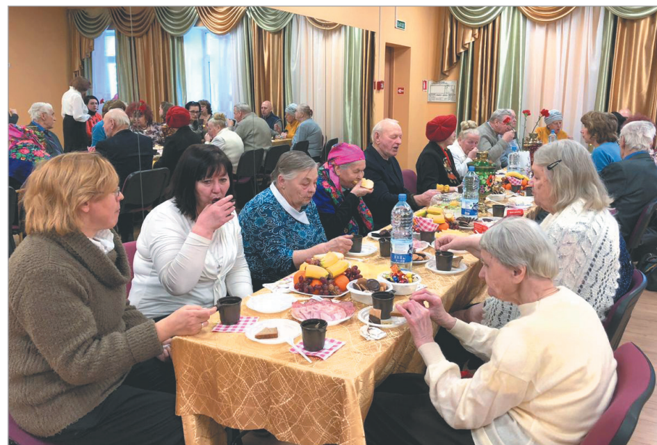
После спектакля гости отправились на чаепитие. Праздничное застолье организовала семья местных предпринимателей, пожелавшая остаться неизвестной