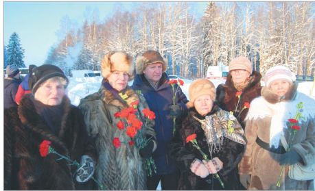
Представители совета ветеранов Заневского городского поселения

В истории нашей страны много страшных и вместе с тем героических страниц. Одной из самых трагических является блокада Ленинграда. Свидетелей тех событий с каждым годом становится все меньше. Но мы бережно храним память о людях и их подвигах, передаем ее следующим поколениям. И пока жива эта традиция, жива надежда, что подобного больше не повторится.