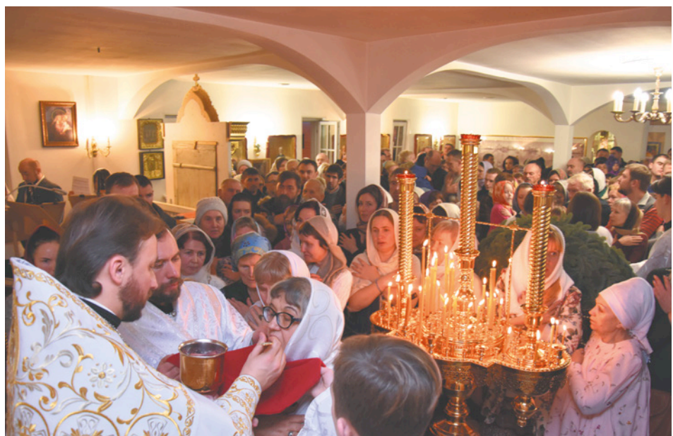
Во время Рождественской ночи в храме причастились более 300 верующих