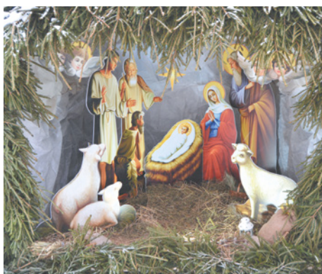
Вертеп, установленный перед входом в храм

Православная Россия встретила один из главных христианских праздников – Рождество Спасителя Иисуса Христа. Для миллионов верующих оно имеет большее значение, чем Новый год. От него начинается летоисчисление. С него берет разбег в сердце человека каждый начинающийся год. О том, как отметили Рождество в Кудрово, – в нашем репортаже.