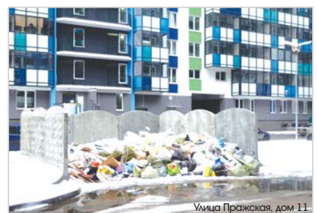
Улице Пражская, дом 11