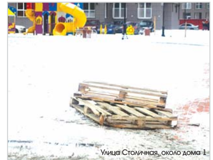
Улице Столичная, около дома 1

В администрации поселения сообщили, что по итогам проверки, проведенной административной комиссией, в адрес нарушителей направляются предписания с требованием в установленные сроки устранить обнаруженные недостатки. Адреса повторно осмотрят, и если управляющие компании не исправят недочеты, то будут нести административную ответственность в виде штрафа.