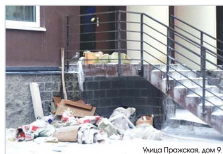
Улице Пражская, дом 9