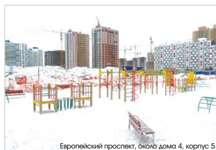
Европейский проспект, около дома 4, корпус 5