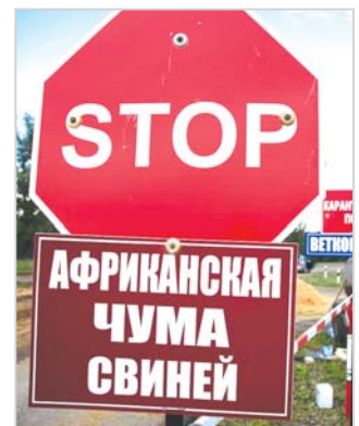
ГБУ ЛО «СББЖ Всеволожского района»

По всем вопросам обращаться в государственную ветеринарную службу Всеволожского района по тел.: 8 (813-70) 20-053; 45-105.