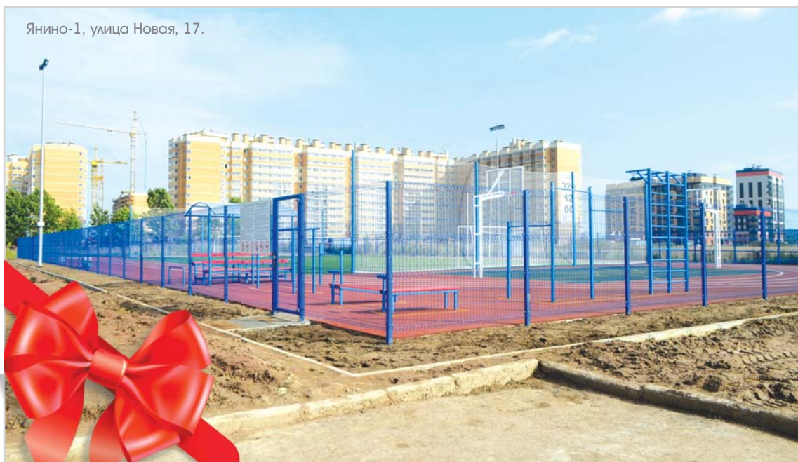
Янино-1, улица Новая, 17.